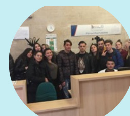
PCTO Agenzia delle Entrate