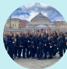
PCTO Maggio dei Monumenti